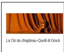
La Clé du chapeau-Quelli di Grock

Il nostro ex presidente ci presenterà alcuni dei suoi lavori più significativi realizzati nel corso della sua attività fotografica, iniziata negli anni '70.